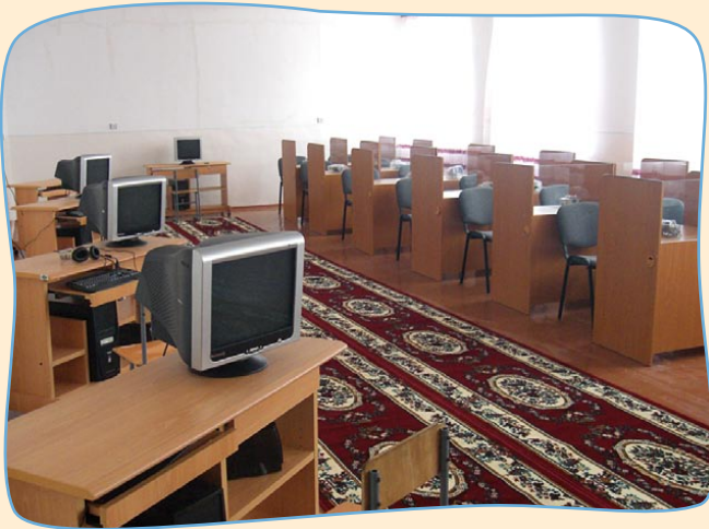
Die Ausbildung am Computer ist nicht immer ganz einfach bei den häufigen stundenlangen Stromausfällen.