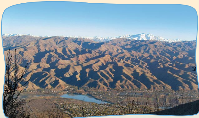
Tadschikistan in Zentralasien: Der grösste Teil des Landes ist karges Bergland.

Internationale Wirtschafts- und Finanzkrisen bringen es im Allgemeinen mit sich, dass die Schere zwischen Arm und Reich, Nord und Süd, grösser wird. Das ist längst erforscht, durch aktuelle Entwicklungen belegt und gilt auch für Tadschikistan. Präsident Emomali Rachmon rief die Bevölkerung unlängst dazu auf, einen Lebensmittelvorrat anzulegen, um eine Hungersnot zu vermeiden. Armut und Resignation in Tadschikistan sind beängstigend. Kinder leiden unter Situationen wie diesen am meisten.