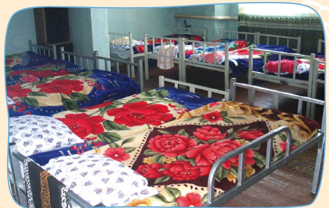
Enge Platzverhältnisse: In den Schlafsälen herrscht nüchterne Ordnung.