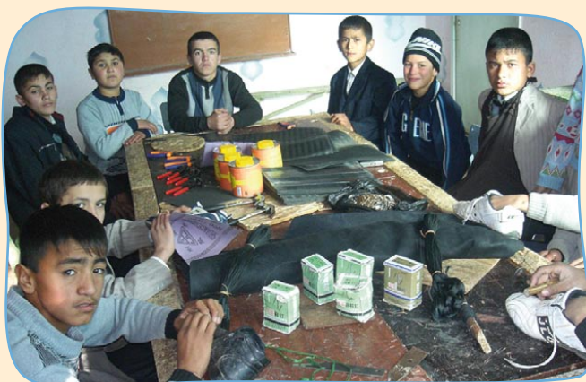
Hilfe zur Selbsthilfe: Die Jungen erhalten Unterricht im Schustern.

Dank Ihrer Hilfe konnten die Kinder und Jugendlichen mit Lebensmitteln, Hygieneartikel, Medikamenten, Schulsachen, neuen Betten und -decken und weiteren Lebensnotwendigkeiten versorgt werden. Auch der Transport in ein Prothesenzentrum konnte finanziert werden. Es ist sehr wichtig, dass die Prothesen regelmässig angepasst und repariert werden.