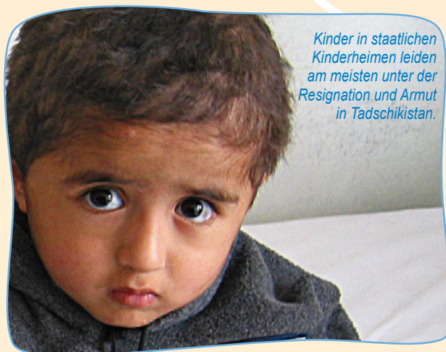
Kinder in staatlichen Kinderheimen leiden am meisten unter der Resignation und Armut in Tadschikistan.

Dank Ihrer Hilfe können die Kinder in den von ORA unterstützten Internaten, aber nach wie vor mit Lebensmitteln, Schulgeld und vielen weiteren notwendigen Dingen des täglichen Bedarfs versorgt werden. Zurzeit sind immer noch 1'066 Kinder auf Ihre Hilfe angewiesen.