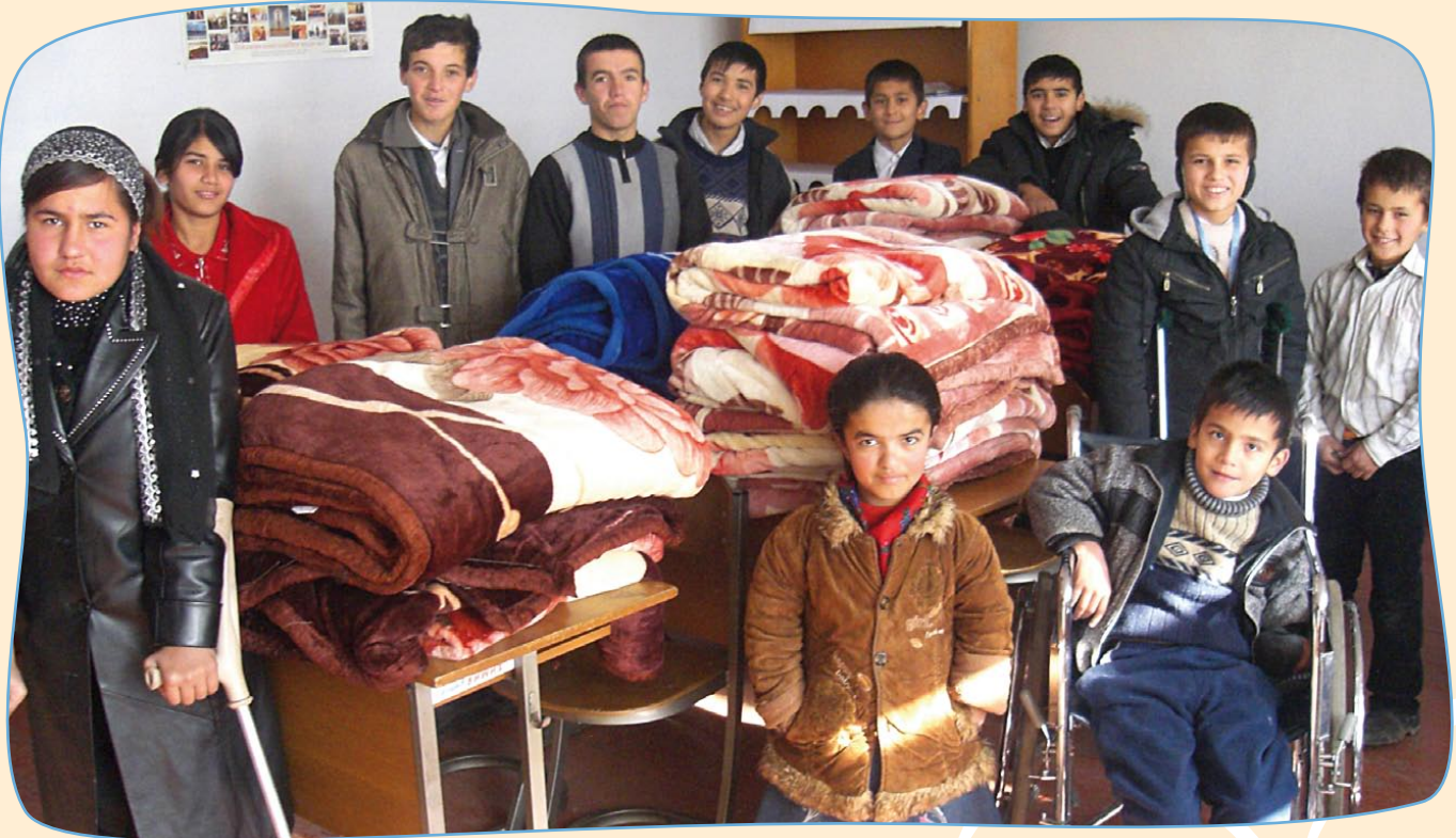
Im Heim für Kinder mit Kinderlähmung konnten Dank der Patenschaften warme Bettdecken angeschafft werden. Bei kaum beheizten Räumen und Minustemperaturen im Winter dringend notwendig.