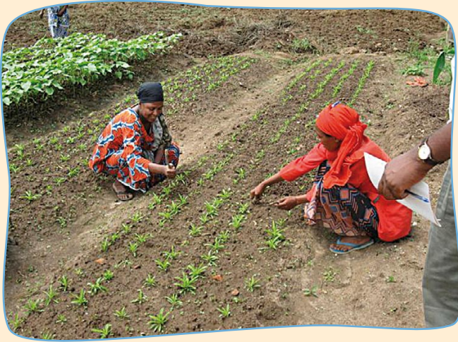
Wir verbessern die Situation durch Gemüse- und Mangopflanzungen, durch Bienenzucht und indem wir Fischteiche anlegen.