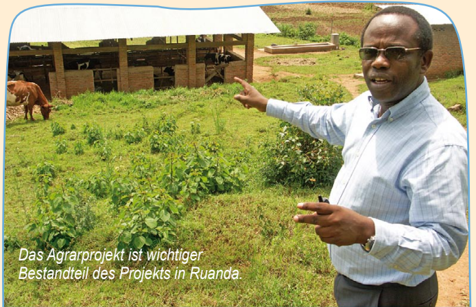
Das Agrarprojekt ist wichtiger Bestandteil des Projekts in Ruanda.

Es ist uns wichtig, den Mädchen und Jungen eine vernünftige Einstellung zu vermitteln. Wir müssen das Thema Natur und Umwelt als Ganzes sehen. Es geht nicht darum, den Kindern einzelne Dinge beizubringen. Sie müssen eine positive Einstellung zum Umweltschutz verinnerlichen. Lassen wir sie in diesem Bewusstsein aufwachsen. Und das möchten wir mit unseren Camps erreichen. Dort diskutieren wir immer wieder darüber.