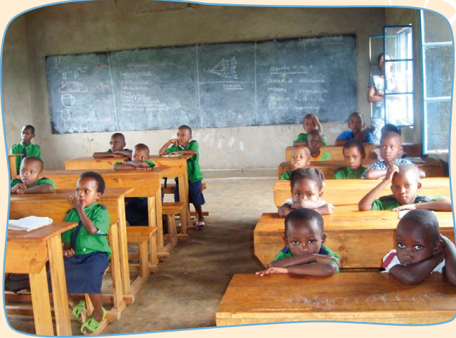
Dank den Patenschaften sind die Kosten für Schulgebühren und Lehrmaterialien sowie tägliche Mahlzeiten gedeckt.