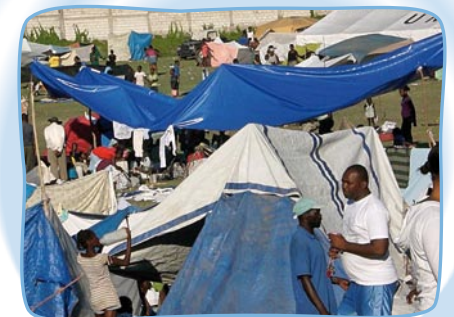
Provisorische Zeltstädte: Es wird noch Monate dauern, bis diese Menschen wieder feste Häuser haben. ORA hilft unter anderem mit einer Anlage zur Wasseraufbereitung.